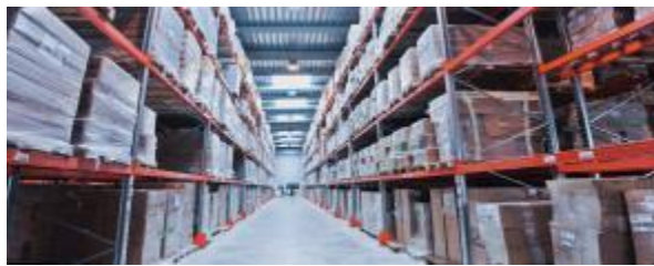
Logística & Supply Chain